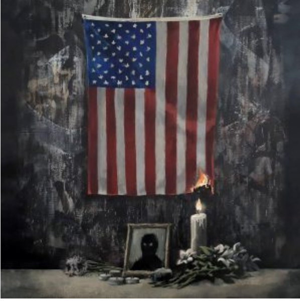
Banksy'nin George Floyd çalışması. 2020.

Sunduğumuz bu retrospektiften de anlaşılacağı üzere kolluk kuvvetlerinin şiddete yatkın, pragmatik ve yozlaşmış imajı, hemen hemen bu teşkilatların kuruluşu ile akrandır. Bu tip teşkilatlar her dönem; coğrafya, hükümet hatta rejim ayırt etmeksizin egemen sınıfın maşası olmuştur ve devlet eliyle egemen sınıflarla menfaatleri çakışanlara “meşru” zorbalık uygulamıştır. Her seferinde çok büyük acılarla farkına varmak zorunda kaldığımız bu gerçek bize bir kez daha hatırlatmalıdır ki bu sistem reforme edilemez, devrim elzemdir, devrimden daha azına razı olunamaz!