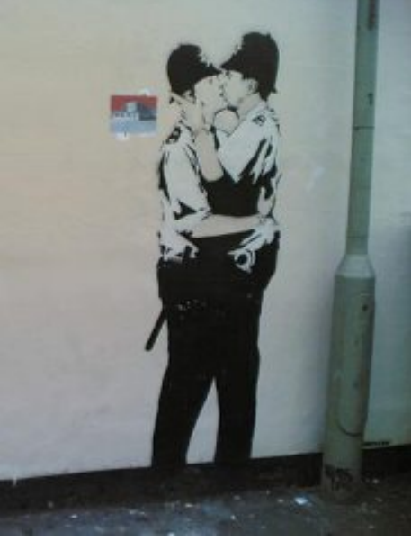
Kissing Coppers, Grafiti, 2004, Brighton, Banksy