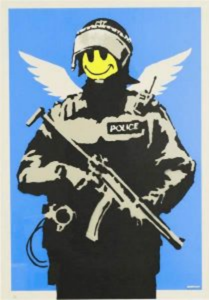
Flying Coppers, Baskı, 2003, Londra, Banksy