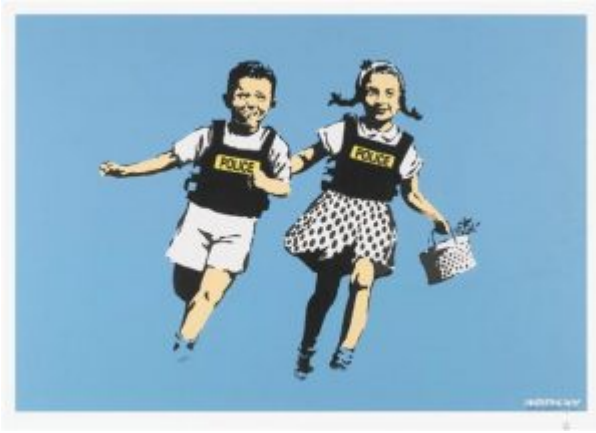
Jack and Jill, Baskı, 2005, Banksy