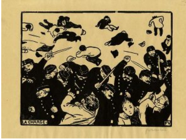
La charge ,1893 (Hüküm)