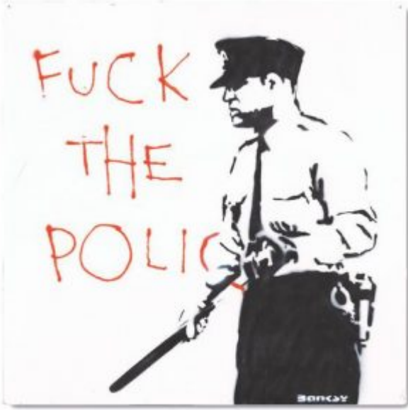
Fuck The Police, Grafiti, 2000, Banksy