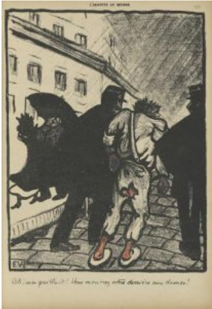
“Ah,mon gaillard! Vous montrez votre derrière aux dames!” ,1902 (Arkadaşım! Kıçını hanımlara gösteriyorsun!)

Örneklerde görülebileceği üzere polisin genel manada adaletsiz ve şiddete meyilli bir imajı vardır. Egemen sınıflar tarafından toplumun geri kalanına dayatılmak istenen, düzenin ve adaletin savunucusu imajı toplum tarafından benimsenmemiştir hatta alay konusu olmuştur.