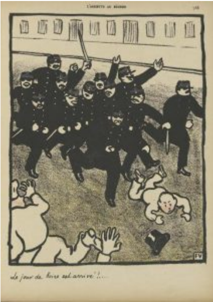
“Le jour de boire est arrivé !... (İçme günü geldi!),1902 Fransa milli marşında geçen “Le jour de gloire est arrivé” yani zafer günü geldi mısrasına yapılan bir gönderme.